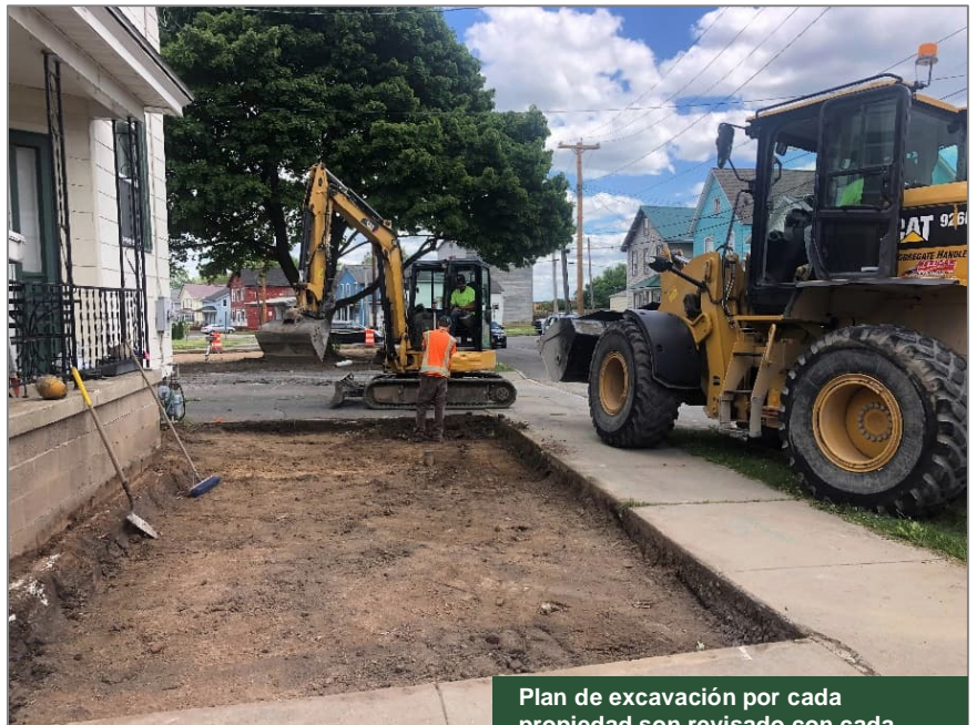
Plan de excavación por cada propiedad son revisado con cada dueño de parcela antes de la construcción.

El proyecto se está financiando y ejecutando según el programa Superfondo Estatal (State Superfund program). Los documentos relacionados con la limpieza de este sitio se pueden encontrar en las ubicaciones identificadas abajo en "Para Más Información." Los detalles adicionales del sitio, como resúmenes de evaluación ambiental y de salud, están disponibles en el sitio web del DEC, en: https://www.dec.ny.gov/chemical/107812.html .