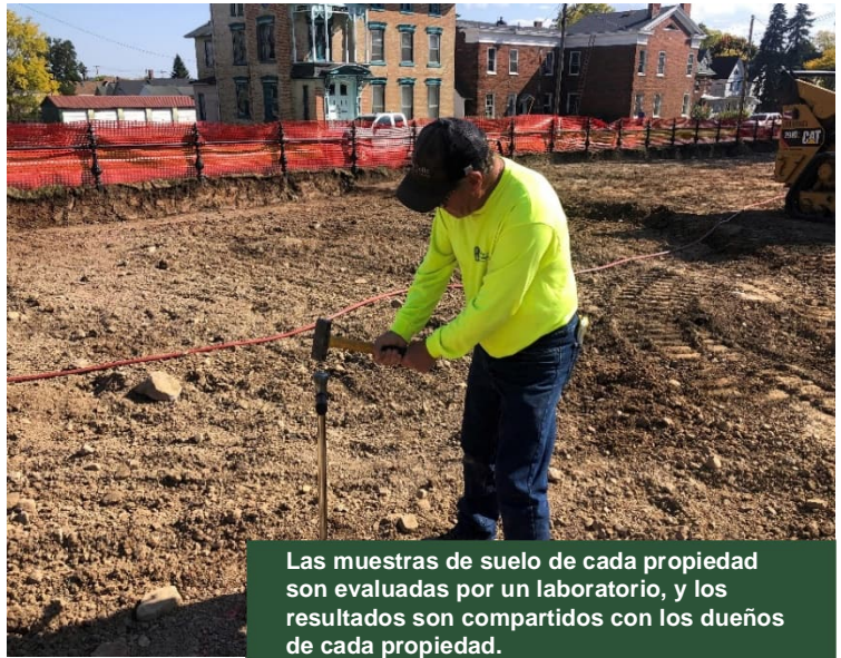
Las muestras de suelo de cada propiedad son evaluadas por un laboratorio, y los resultados son compartidos con los dueños de cada propiedad.

DEC y sus consultores han completado el muestreo de suelos dentro del área de remediación que requerido para preparar el plan de excavación y restauración de propiedad específica, y ha compartido estos resultados con los dueños de la propiedad. DEC continúa realizando muestreos adentro de la zona de remediación para informar la preparación de planes específicos de excavación y restauración de las propiedades. DEC continuará manteniendo informados a los residentes del área del horario de la limpieza. DEC están dirigiendo de forma adaptativa este proyecto para asegurar que las actividades de remediación y restauración se completen de manera eficiente y práctica y para asegurar la protección de la salud pública y el ambiente.