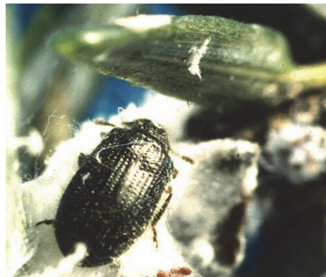
Laricobius nigrinus alimentándose del HWA

Los insecticidas químicos se pueden usar para tratar los árboles que ya están infestados o como una medida preventiva en un área de alto riesgo de infestación. Estos son útiles para tratar árboles individuales, ornamentales o de alto valor, pero no son prácticos ni económicos para tratar los bosques. Dos insecticidas que han demostrado resultados prometedores son el imidacloprid y el dinotefurán. Ambos deben ser aplicados por un aplicador de pesticidas certificado, y cualquiera puede eliminar al HWA de manera individual. Sin embargo, la aplicación de ambos insecticidas a un árbol infestado combina la efectividad inmediata del dinotefurán de acción rápida con el imidacloprid de protección de largo plazo, dejando al árbol libre de adélgidos hasta por siete años.