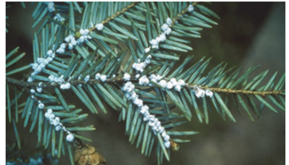
Ovisacos lanudos blancos en una rama de tuya oriental