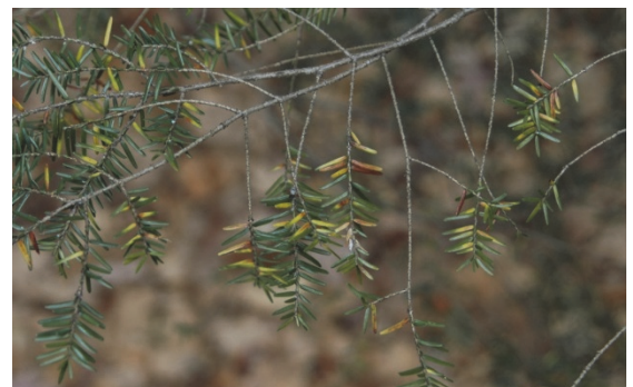
Daño causado por HWA a las agujas y las ramas