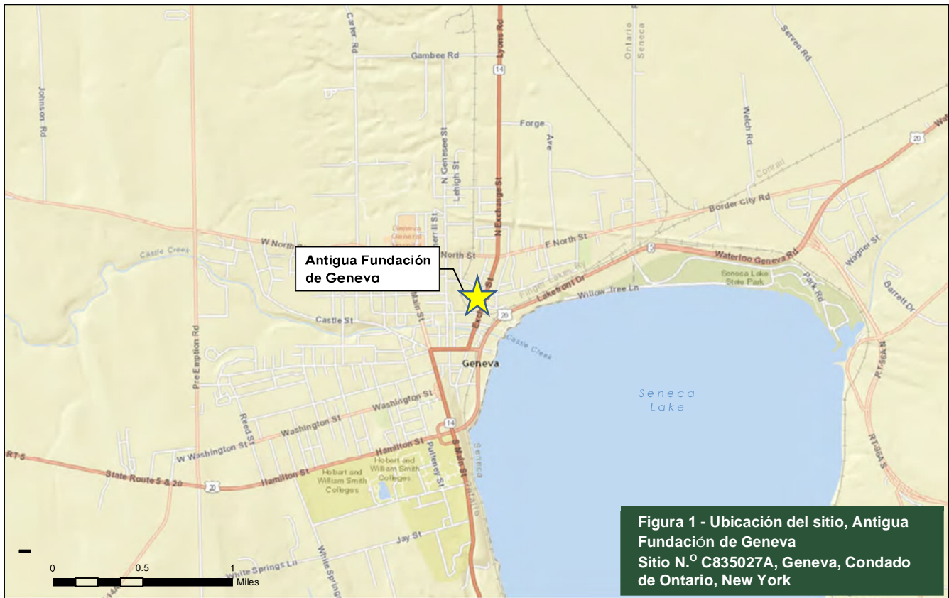
Figura 1 - Ubicación del sitio, Antigua Fundación de Geneva Sitio N.º C835027A, Geneva, Condado de Ontario, New York