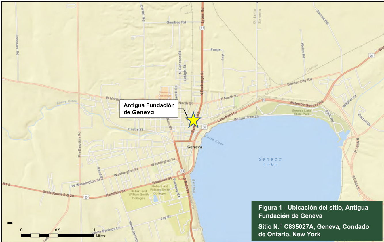
Figura 1 - Ubicación del sitio, Antigua Fundación de Geneva Sitio N.º C835027A, Geneva, Condado de Ontario, New York