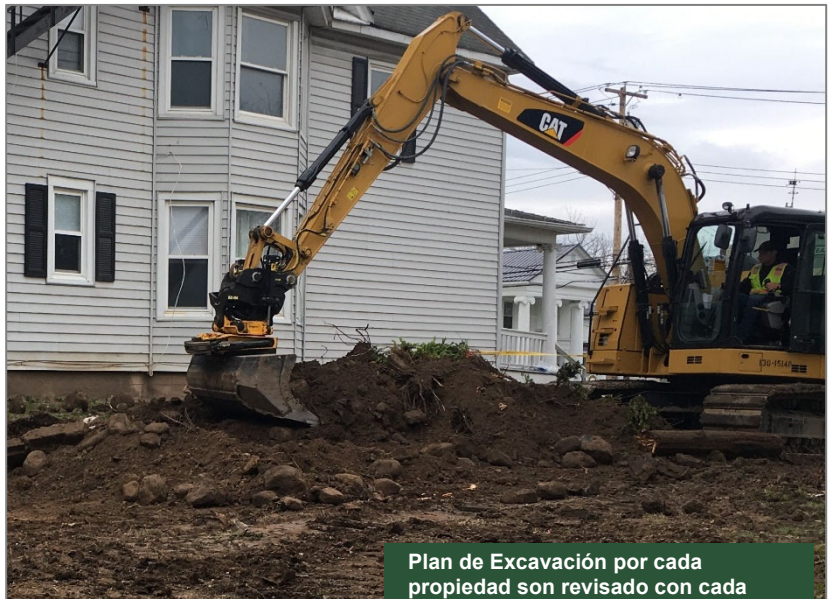
Plan de Excavación por cada propiedad son revisado con cada dueño de parcela antes de la construcción.

El proyecto se está financiando y ejecutando según el programa Superfondo Estatal (State Superfund program). Los documentos relacionados con la limpieza de este sitio se pueden encontrar en las ubicaciones identificadas abajo en “Para Más Información.” Los detalles adicionales del sitio, como resúmenes de evaluación ambiental y de salud, están disponibles en el sitio web del DEC, en: https://www.dec.ny.gov/chemical/107812.html .