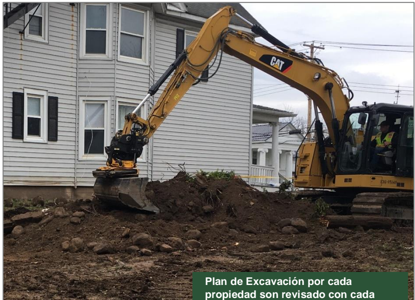
Plan de Excavación por cada propiedad son revisado con cada dueño de parcela antes de la construcción.

El proyecto se está financiando y ejecutando según el programa Superfondo Estatal (State Superfund program). Los documentos relacionados con la limpieza de este sitio se pueden encontrar en las ubicaciones identificadas abajo en “Para Más Información.” Los detalles adicionales del sitio, como resúmenes de evaluación ambiental y de salud, están disponibles en el sitio web del DEC, en: https://www.dec.ny.gov/chemical/107812.html .