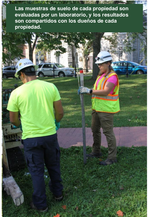
Las muestras de suelo de cada propiedad son evaluadas por un laboratorio, y los resultados son compartidos con los dueños de cada propiedad.

DEC continúa realizando muestreos adentro de la zona de remediación para informar la preparación de planes específicos de excavación y restauración de las propiedades. DEC continuará manteniendo informados a los residentes del área del horario de la limpieza. DEC están dirigiendo de forma adaptativa este proyecto para asegurar que las actividades de remediación y restauración se completen de manera eficiente y práctica y para asegurar la protección de la salud pública y el ambiente.