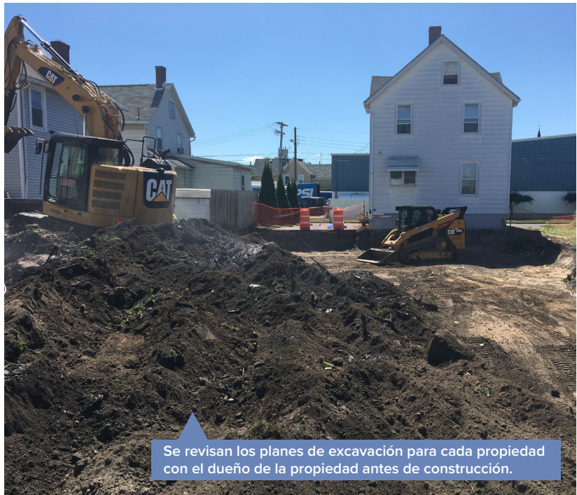
Se revisan los planes de excavación para cada propiedad con el dueño de la propiedad antes de construcción.

El proyecto se financiará y se realizará según el programa Superfondo Estatal (State Superfund program). Los documentos relacionados con la limpieza de este sitio se pueden encontrar en las ubicaciones identificadas abajo en "Para Más Información." Los detalles adicionales del sitio, como resúmenes de evaluación ambiental y de salud, están disponibles en el sitio web del DEC, en: http://www.dec.ny.gov/chemical/107812.html .