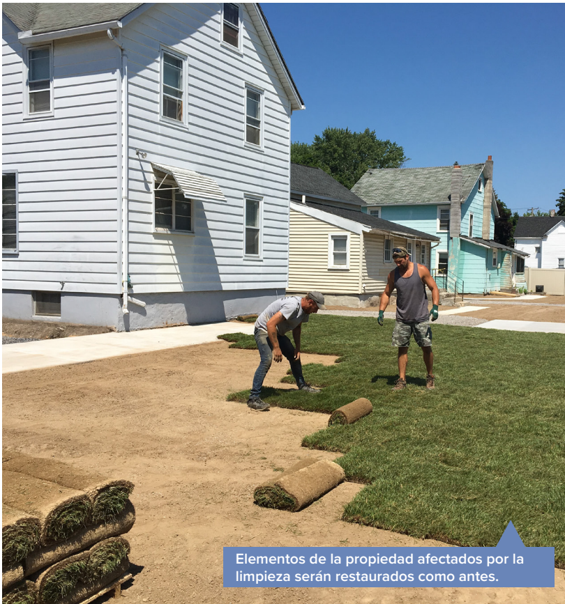
Elementos de la propiedad afectados por la limpieza serán restaurados como antes.