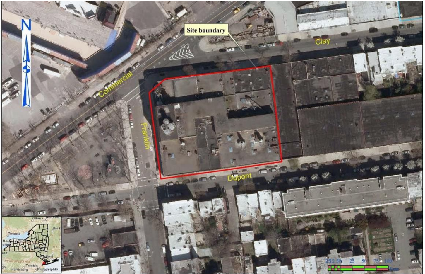
Figura de localización del emplazamiento